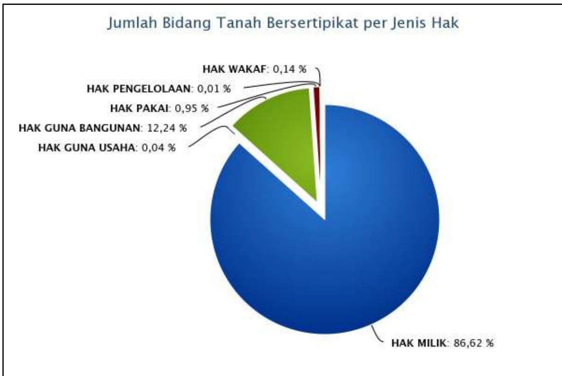
Tabulasi Jumlah Bidang Tanah Bersertipikat Per Jenis Hak

Sumber data: Hasil Rekapitulasi Laporan Kantor Pertanahan